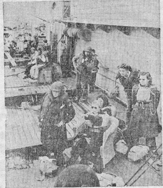
Mujeres de la Cruz Roja de los Estados Unidos a bordo de un transporte que navega por la zona de combate presencian las peripicias del ataque de un submarino nazi. Con los salvavidas puestos miran llenas de interés las maniobras del barco de escolta, que rechazó el ataque antes de que el enemigo pudiera infligir daño alguno.

SE VENDEN Y SE COMPRAN MUEBLES NUEVOS Y USADOS